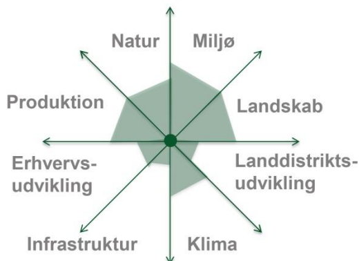
Figur 2. Et eksempel på, hvordan forskellige interesser prioriteres i forhold til hinanden og dermed hvilke indsats, der prioriteres højest.

I Udviklingsplanen redegøres for de indsatsområder, som vurderes at være de væsentligste i forhold til bedriften, lokalområdet og eventuelt andre væsentlige interessenter. Der skal være fokus på de vigtigste informationer, som har eller kan få indflydelse på bedriftens udvikling eller visioner samt ideer, som kan være med til at understøtte bedriftens udvikling eller udvikling af lokalområdet, som bedriften gerne vil være med til at støtte.